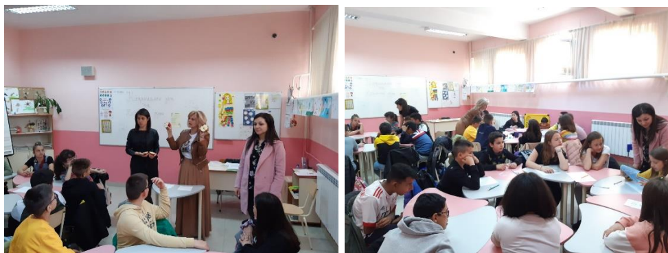
Фигура 2. Моменти от работата.

Ние проведохме урока „Отговор на Големия въпрос“ в стаята за занимания по интереси, но препоръчваме да се направи на по-широко място, за да има повече пространство и учениците да не си пречат, когато дискутират. Всяка група получава листове за отговори и определя един писар. Групите търсят заедно своя свитък, за да се чувстват поравно включени.